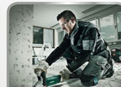
Schleifen und Trennen