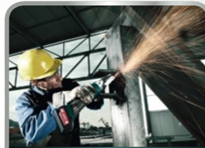
Schleifen und Trennen