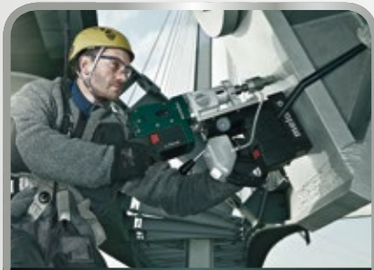
Bohren und Schrauben

Dabei konzentrieren wir uns auf die Anwendungsbereiche Maschinenbau, Werften, Rohstoff-/Energiegewinnung zu Wasser (Ölplattformen/Windparks), Raffinerien, Windenergie, Sonderfahrzeugbau, Rohrleitungsbau und Stromkraftwerke.