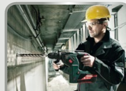
Bohren und Schrauben

Dabei haben wir die Anwendungsbereiche Dach und Holzbau, Fensterbau, Wand und Fassade, Trockenbau, Installation, Bodenlegen, Fliesenlegen und Garten- und Landschaftsbau im Fokus.